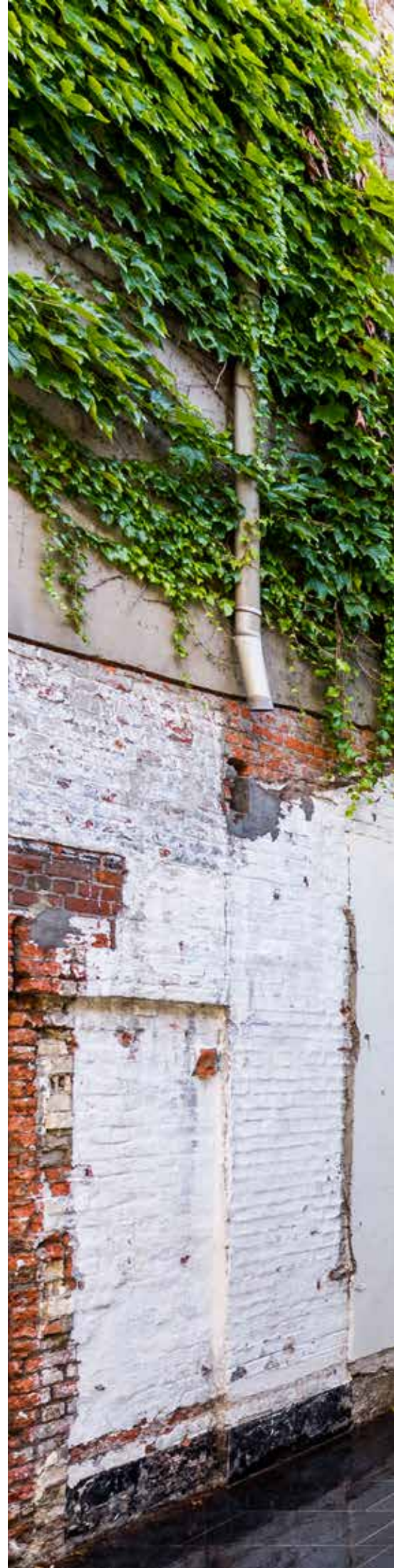
Terca Groen Geglazuurd

De Art Nouveau tegeltjes in de eetruimte binnen hebben een groentint. De keuze voor eenzelfde kleur voor de achterbouw was snel gemaakt. Het volume sluit mooi aan bij de groene klimplanten die via de scheidingsmuren tegen de achterbouw aangroeien.